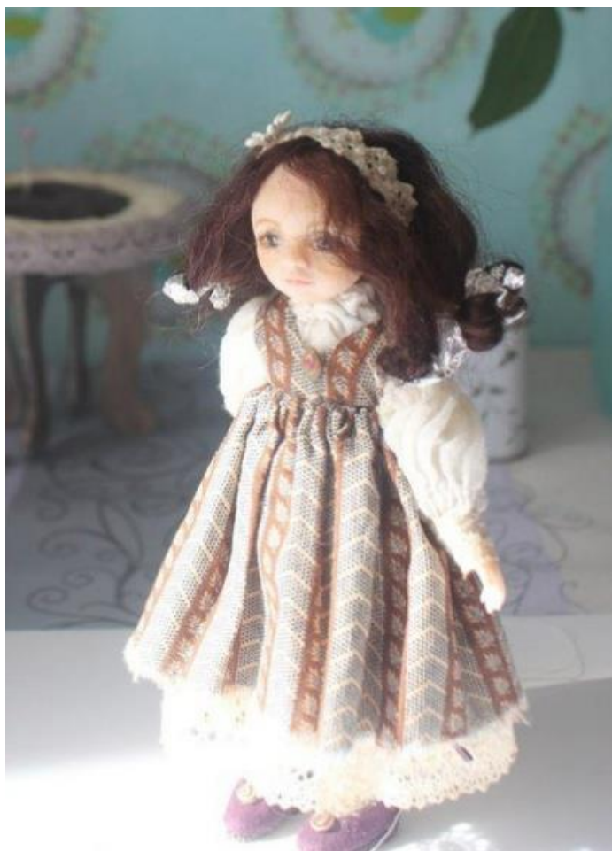
Рис.14 Шарнирная кукла из холодного фарфора.