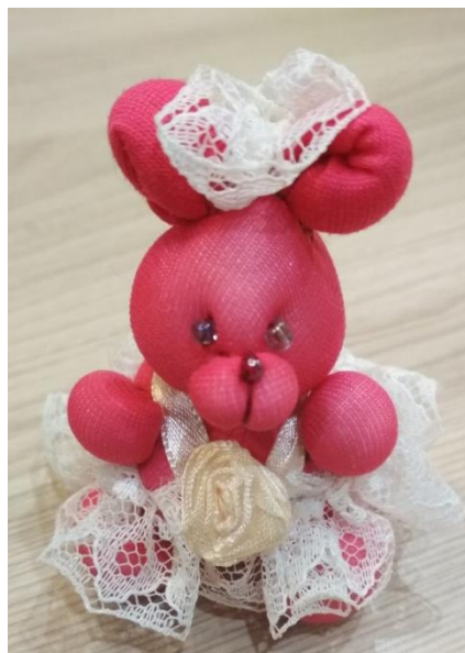
Рис.8 Капроновые мишки