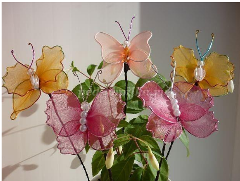
Рис. 12 Букет цветов из капрона.