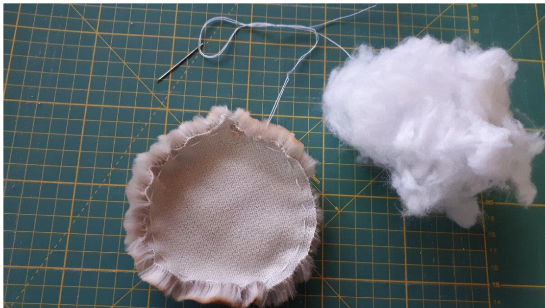
Рис. 4 Народная кукла